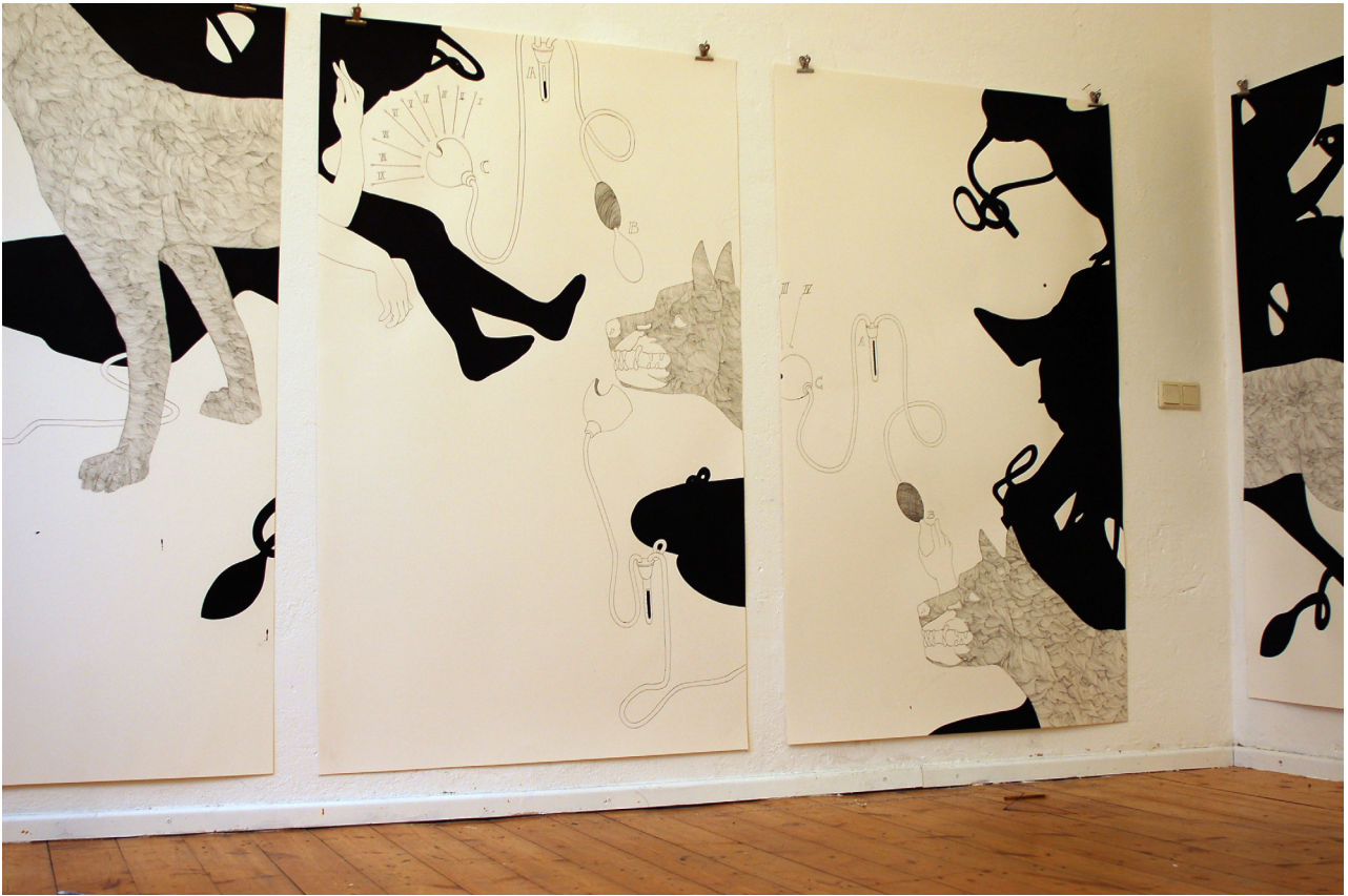
Atelieransicht Zoom 4.1 - Zoom 4.4 November 2009