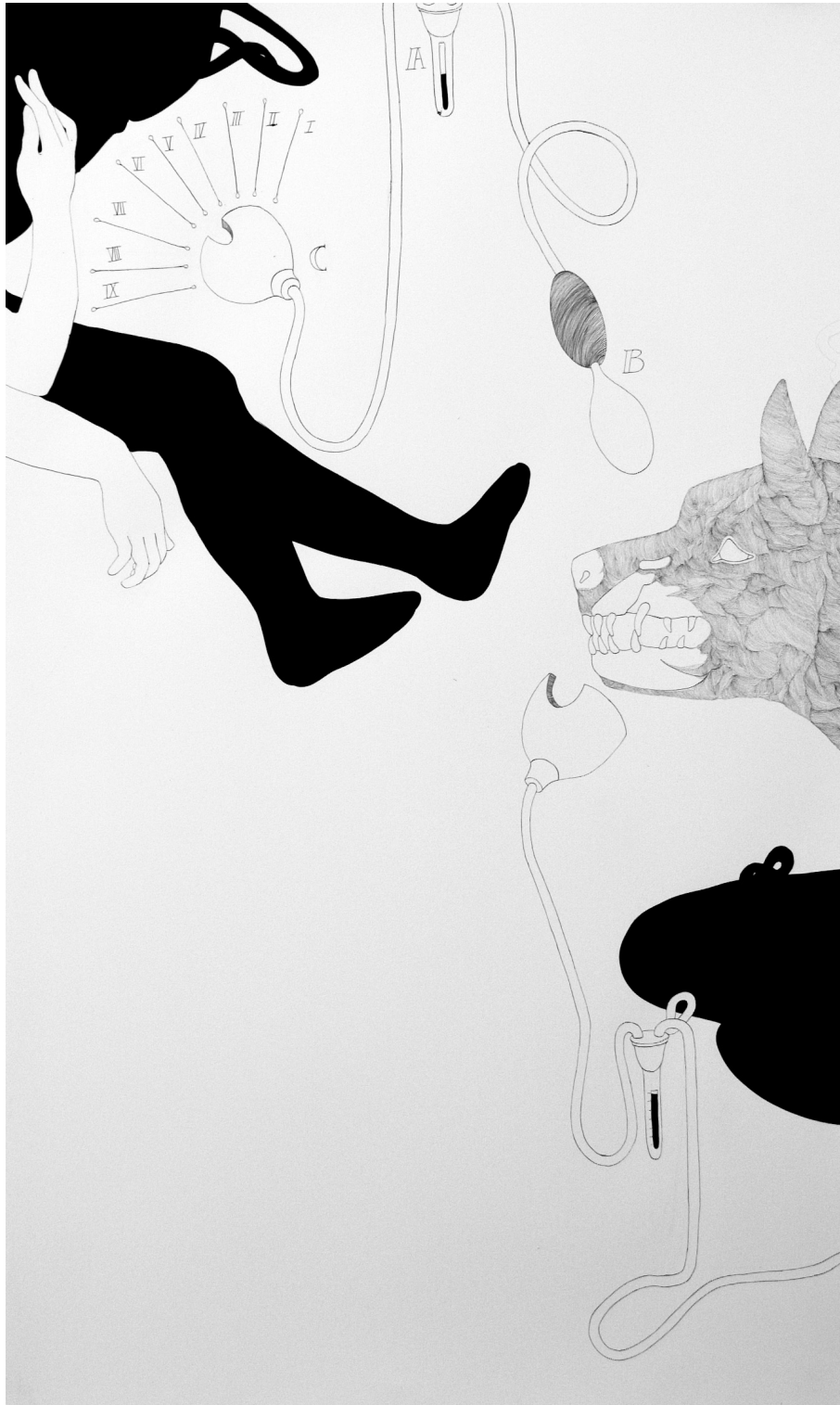
Zoom 4.1 · 2009 · Tusche auf Papier · 110 x 180 cm