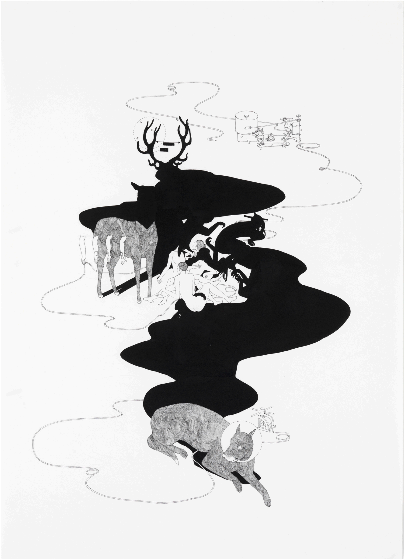
Aus der Serie crossing my fingers · 2009 · Tusche auf Papier · 70 x 100 cm