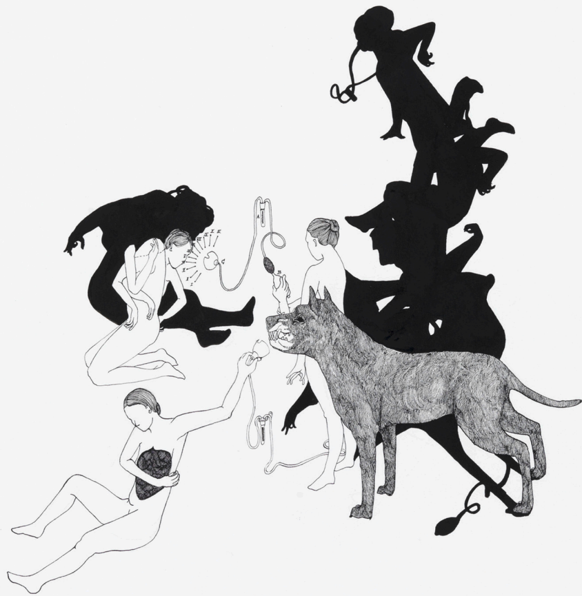
Aus der Serie crossing my fingers · 2009 · Tusche auf Papier · 50 x 64 cm