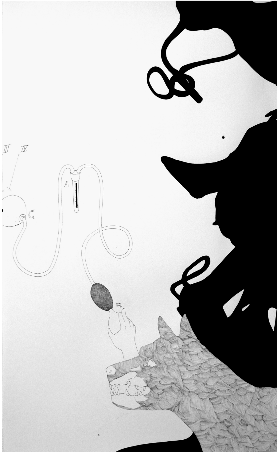
Zoom 4.1 · 2009 · Tusche auf Papier · 110 x 180 cm