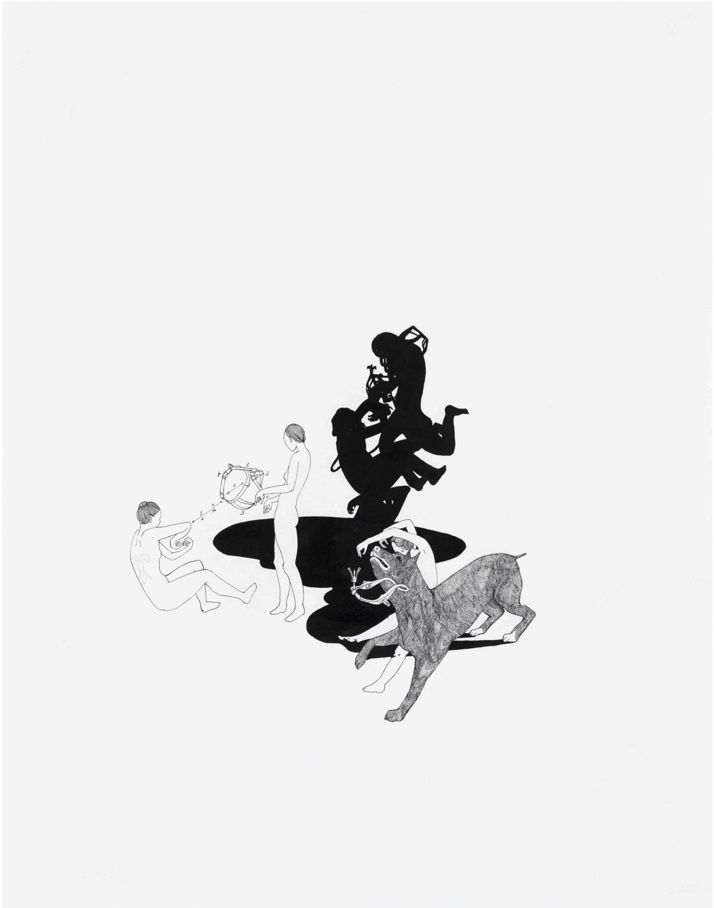
Aus der Serie crossing my fingers · 2009 · Tusche auf Papier · 50 x 64 cm