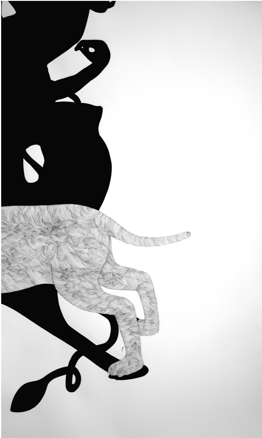
Zoom 4.1 · 2009 · Tusche auf Papier · 110 x 180 cm