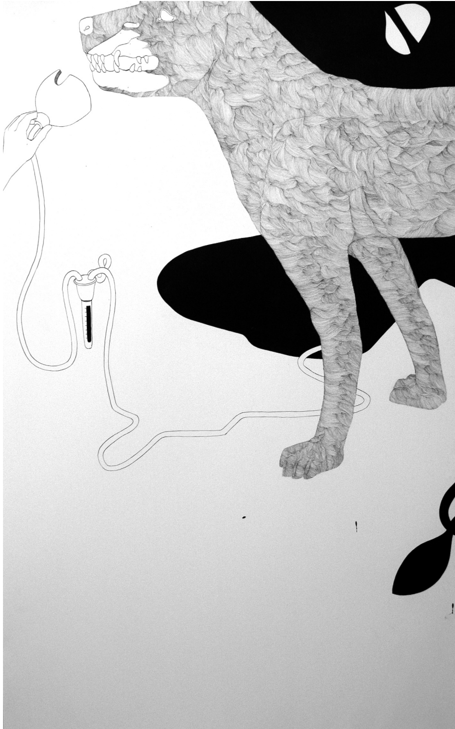
Zoom 4.1 · 2009 · Tusche auf Papier · 110 x 180 cm