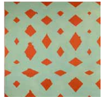
Pierre Haubensak: «Gong (pochoir)», 20800 Franken, Galerie Rosenberg.